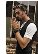
NEOBLU MAX MEN 03166