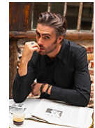
NEOBLU BLAISE MEN 03182