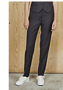
NEOBLU GABIN WOMEN 03163